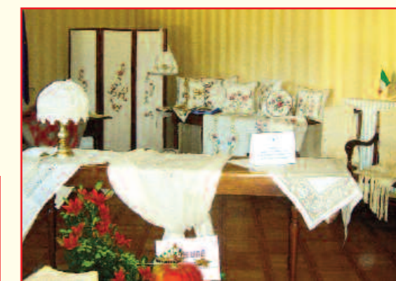
Uno scorcio della mostra