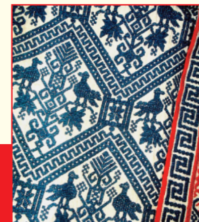
A lato, una coperta in ginestra

Pasquale Filippelli 333/3052529; pasfilip@libero.it